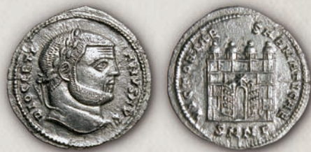
Диоклетијан аргентеј, Никомедија, 295 г.

Во 309 г., Константин I (306-337 г.) повторно спровел монетарна реформа со која била воведена нова златна номинала - солид (654) и негова фракција семис. Околу 324 г. биле воведени и две нови сребрени парични единици, милиаренс и силиква (700-702).