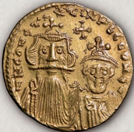
Констанс II, солид (аверс) Константинопол, 651/2-654

Во текот на VII век, на целата територија на Византиската Империја се забележува намалена циркулација на бакарни пари во однос на златните и на сребрените номинални вредности (бидејќи сребреното ковање во VI век било занемарено, во 615 г. бил воведен сребрениот хексаграм, кој претставувал единица помеѓу златниот тремиз и бакарниот фолис). Од територијата на Р Македонија потекнуваат десетина примероци на бакарни пари, дел од една остава со дванаесет сребрени хексаграми и дел од една остава со триесет и два златни солиди и тремизи којашто е дел од Нумизматичката збирка на НБРМ, депонирана во времето на Констанс II (641-668). Една од причините за намалената циркулација на пари е монетарната политика. Во овој период работеле пет ковници на пари, од кои само Константинопол бил активен во источниот дел на Империјата, додека преостанатите четири - Сицилија, Равена, Рим и Картагина, во западниот дел.