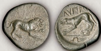
Ликеј, тетробол с.359/58-с.340 г. пр.н.е.

Во Нумизматичката збирка на НБРМ се чува и еден уникатен тетробол на чија аверсна страна е претставен лав, а на реверсот има волк, кој се поврзува со етимологијата на името на Ликеј, но и со Аполоновиот епитетот - Ликеј (волчји).