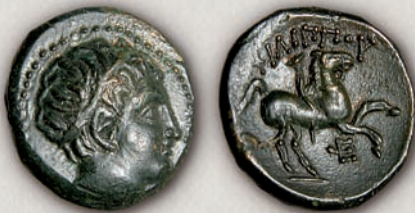
Филип II Македонски, постхумна бронза, Амфипол

Набргу по неговото доаѓање на власт, започнало ковањето на Филиповите сребрени пари во Пела, а околу 357/56 г. пр.н.е. и во Амфипол (105). Со монетарната реформа којашто била спроведена во 345 г. пр.н.е., Филип II, првпат во монетарната историја на Македонија, вовел златна номинала. Златниот статер (104) бил кован во истите ковници во кои биле произведувани сребрените пари, а заради флексибилност на монетарниот систем биле издавани и неговите фракции: 1/2, 1/4 (104a), 1/8 и 1/12 од статерот. За статерите бил користен атичкиот тежински стандард, додека за тетрадрахмите локалниот македонски тежински стандард.