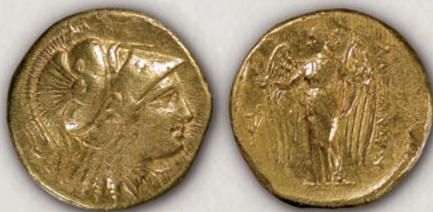
Александар III Македонски дистатер, Амфипол, с.330-320 г. пр.н.е.

Моќта на Александар Македонски, како и високата чистота на металот од кој биле ковани неговите пари условиле овие монети да станат општоприфатено меѓународно платежно средство.