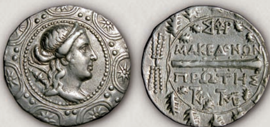
Прва македонска мерида, тетрадрахма, Амфипол, 158-150/49 г. пр.н.е.

Во периодот меѓу 168 и 166 г. пр.н.е. биле ковани бронзени монети на римските квестори Гај Публилиј (208-213) и Лукиј Фулкиниј (214), а набргу потоа и анонимните бронзени изданија со маска на Силен на аверсот и легенда D(ecret)o//MAKE/ΔONΩN на реверсот, чие место на ковање сè уште не е утврдено (215-216).