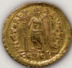
Лав I, солид (реверс) Константинопол, 462 или 466

Покрај симболите поврзани со христијанството, на монетите на Константиј II, Ветраниј и на Константиј Гал се јавува инскрипцијата NOB SIGNO VICTOR ERIST (со овој знак победувај) (709). Според легендата што ја пренесува историчарот Евзебиј во делото „Животот на Константин“ ( Vita Constantini ), Константин I пред битката кај Милвискиот мост имал визија во која сонцето се претворило во крст, а потоа се појавиле овие зборови. Во битката, војниците на Константин I и Ликиниј I носеле штитови на кои се наоѓал Христовиот монограм. Константин извојувал победа и во 313 г. бил потпишан познатиот едикт.