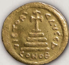
Тибериј II, солид (реверс) Константинопол, 578-582

Од иконографски аспект, Јустин II ја заменил реверсната претстава на ангел со паганската претстава на Константинопол со глобус со крст, единствениот христијански симбол присутен на солидите (835). Аверсот на фолесите и на полуфолесите е препознатлив преку претставата на владетелскиот пар (839-840). Софија е првата жена чиј стилизиран лик се наоѓа на византиските монети и воедно прва императорка која е претставена паралелно со императорот. Формално, правото на своето присуство врз бакарните монети Софија го обезбедила со раѓањето машко дете.