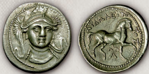
Авдолеон, тетрадрахма пред 305 г. пр.н.е.

патрај бил наследен од неговиот син Авдолеон (315 - 286/5 г. пр.н.е.) (16-18), кој ковал повеќе видови тетрадрахми, ди-драхми, драхми и тетраболи на чии аверси најчесто е претставена Атина. Во почетокот на своето владеење тој имал добри односи со Македонија, којашто во 310 г. пр.н.е. му помогнала во борбата против Автаријатите. Во периодот од 315 до 306 г. пр.н.е., монетите биле ковани според пајонскиот тежински стандард, претставите на неговите порани драхми биле блиски со оние на Патрај (портрет на кралот на аверсот и протом на дива свиња на реверсот), а еден тип на тетраболи на аверсот имаат претстава на Дионис, наместо вообичаената претстава на Атина. Во 306 г. пр.н.е. Авдолеон, следејќи го примерот на дијадосите ја зел титулата базилеј и почнал да издава тетрадрахми според атичкиот тежински стандард, коишто типолошки биле исти со оние на Александар III Македонски, што исто така било карактеристично за наследниците на Александар. Добрите односи со Македонија биле прекинати во времето на македонската династија на Антигонидите. Во 289-88 г. пр.н.е., кога Антигон Гонат го зазел главното пристаниште на Атина, Авдолеон го снабдувал градот со жито и за таа помош собранието донело одлука нему и на неговите наследници да им биде доделено атинско граѓанско право, а на агората да биде подигната негова бронзена коњаничка статуа.