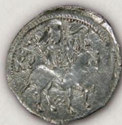
Волкашин, 1365-1368 динар (аверс)

Покрај владетелски монети, на крајот од XIV век се појавиле градски ковања. Скопје, како значаен воен и трговски центар, околу 1395 г. започнал со издавање сопствени динари на кои било забележано името на градот.