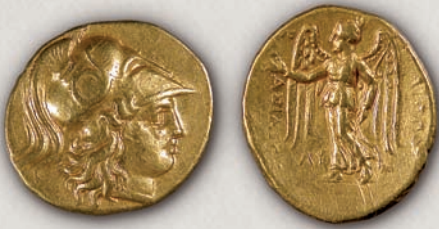
Филип III Аридеј статер, Вавилон, 323-317 г. пр.н.е.

По смртта на Александар III, на територијата на Македонија циркулирале постхумните монети на Филип II и Александар III заедно со монетите на кралевите Филип III Аридеј (323-317 г. пр.н.е.) и Касандар (316-297 г. пр.н.е.).