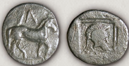
Александар I, лесен тетробол 476/75-460 г. пр.н.е.

Историјата на македонското кралско ковништво започнува со Александар I Филхелен (498-454 г. пр.н.е.). Имено, по повлекувањето на Персијците, околу 480 г. пр.н.е., започнало политичкото анектирање на областите Крестонија, Бизалтија и Мигдонија кон Македонија. Во регионот што го населувале Бизалтите се наоѓала планината Дисорон, позната по своите богати рудници од кои, според Херодот, Александар I добивал по еден талант сребро дневно (околу 26 кг). Пред 480 г. пр.н.е., заедницата на Бизалтите издавала свои монети чии претстави останале исти со нивното влегување во Македонското Кралство, така што практично овие монети, на чија реверсна страна било додадено името на Александар, претставувале негови први парични изданија.