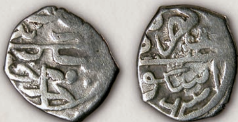
Бајазит II (1481-1512) акча, Скопје

По битката кај Черномен на реката Марица во 1371 г. биле интензивирани отоманските напади на Балканот. До крајот на XIV век, врз територијата на Македонија била воспоставена отоманската власт, а со тоа влегле во циркулација парите на отоманскиот монетарен систем. Низ целата Империја биле отворени повеќе ковници кои требало да ги задоволат нејзините економски и фискални потреби.