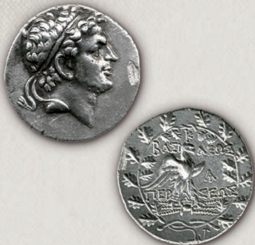
Персеј тетрадрахма, 179-168 г. пр.н.е.

Третата македонска војна (171-168 г. пр.н.е.) била одлучувачка во конечното решавање на политичката иднина на Македонија. Со цел да ја зацврсти позицијата на кралството, Персеј (179-168 г. пр.н.е.), син и наследник на Филип V, презел дипломатски активности со кои биле обновени односите со Хелата и бил склучен сојуз со Селвкидите во Азија. Во 172 г. пр.н.е., тој бил обвинет од римскиот Сенат дека планира повторно да ја потчини Хелата под македонска власт и во 171 г. пр.н.е. била објавена војната. Во почетокот, македонската фаланга имала успех и во 169 г. пр.н.е. римската легија била поразена, но по преземањето на командата од страна на Емилиј Паул, на 22 јуни 168 г. пр.н.е. Персеј ја изгубил битката.