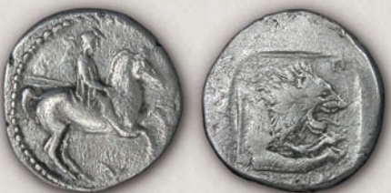
Пердика II, тежок тетробол 437/6-432/1 г. пр.н.е.