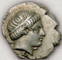
Патрај, драхма (аверс) с. 340/35-315 г. пр.н.е.

Во времето на следниот пајонски крал, Патрај (340/35-315 г. пр.н.е.) продолжило ковањето на истите номинали, тетрадрахми, драхми (12-14) и тетроболи (15), според пајонскиот тежински стандард. Аверсниот тип со претстава на Аполон на аверсната страна на тетрадрахмите исто така бил задржан од претходниот владетел. На неговите тетрадрахми се познати два типа на реверсни претстави, едната е со глава на коњ, којашто е поретка, а на другата има претстава на коњаник кој прободува паднат непријател. Особено е интересна аверсната претстава на неговите драхми и тетроболи каде што е претставен млад маж со тенија на главата, за кој се смета дека е портрет на самиот владетел.