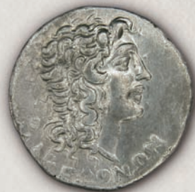
Ајсилас, тетрадрахма, Тесалоника, с.90-70 г. пр.н.е.

Формалната автономија која ја имала Македонија не траела долго и по неуспешното востание на Андриск (Псевдо Филип) во 148 г. пр.н.е., таа станала римска провинција. Во овој период било дозволено ковање тетрадрахми со легенда \text{ΜΑΚΕΔΟΝΩΝ} и \text{ΛΕΓ ΜΑΚΕΔΟΝΩΝ} од типот Артемида во македонски штит на аверсот и суровица во дабов венец на реверсот. Сребрени пари биле ковани и од римскиот квестор Ајсилас (225-227) и легатот Сура чии монети ја носат легендата \text{ΜΑΚΕΔΟΝΩΝ} и претстава на главата на Александар III Македонски.