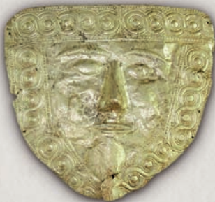
Златна посмртна маска на локална владетелка, VI/V век пр.н.е, Охрид.

Почетокот на монетоковањето на територијата на Р Македонија датира од крајот на VI век пр.н.е., кога пајонските заедници почнале да ги издаваат своите сребрени монети, само еден век подоцна од појавата на монетите во светот.