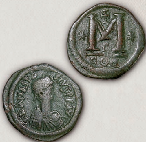
Анастасиј I 40 нумии, Константинопол, 512-517

Монетите кои биле ковани во негово време (790-797) имаат иста иконографија како и монетите на Анастасиј I. Единствената промена се случила во 522 г., кога женската претстава на Викторија на реверсната страна на константинополските солиди била трансформирана во машки ангел со едноставно отстранување на појасот од нејзинот хитон.