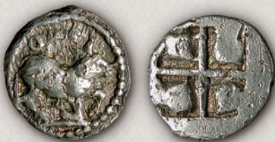
Орески, трихемиобол, 490-480 г. пр.н.е.

На крајот од VI и во текот на V век пр.н.е., племињата кои ги населувале регионите на Пајонија, Македонија и Тракија влегле во своевидна монетарна унија, па нивните пари биле ковани со ист тежински стандард, имале исти номинали и иконографија која е блиска, но сепак со белег на посебност, а била поврзана со нивната религија и со секојдневниот живот. Парите што биле ковани пред 480 г. пр.н.е. содржат претстави само на аверсната (предната) страна, додека на реверсот (задната страна) е втиснат инкузен квадрат, отпечаток што настанал во самиот процес на нивната изработка.