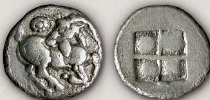
Мигдонија (?), диобол 500-480 г. пр.н.е.