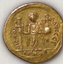
Јустин I, солид (реверс), 522-527 г.