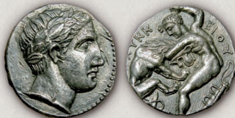
Ликеј, тетрадрахма с. 359/58-с.340 г. пр.н.е.

Ликеј (с.359/6 - с.340/35 г. пр.н.е) е првиот пајонски владетел кој ковал свои пари, тетрадрахми (10-11), драхми и тетроболи, а за кого има податоци во пишуваните извори. Мотивите на неговите пари асоцираат на поврзаност со македонската кралска куќа (Севс, борбата на Херакле со немејскиот лав), а аверсната претстава на Аполон, дел од неговите тетрадрахми ги поврзува со ковниците во Олинт и Дамасиј.