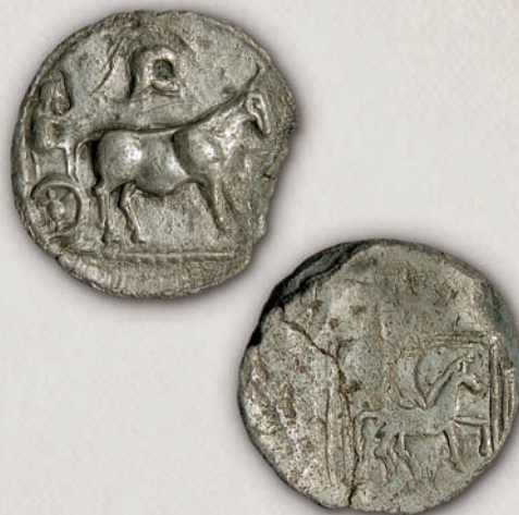
Лајаи, октодрахма по 480 г. пр.н.е.

Препознатлива претстава на монетите на Ихне е тркалото со четири пречници. Во линеарното писмо Б, со истиот знак се означувал зборот тркало, кое како значајна технолошка иновација во Европа се појавило во средината на вториот милениум пр.н.е. Тркалото, како дел од Сончевата кола, се доведува во врска со соларниот култ и е познато како сончево тркало. Овој универзален знак е еден од најстарите религиозни симболи во светот.