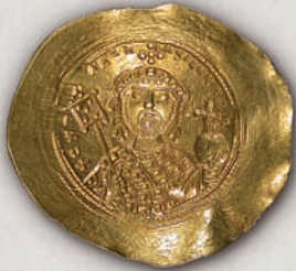
Константин IX Мономах номизма хистаменон (реверс) Константинопол, 1042-1055

На крајот од X и почетокот на XI век, територијата на Македонија претставувала центар на Самуиловото Царство. Царот Самуил (997-1014), прво од Преспа, а потоа од Охрид, владеел со една огромна територија, која ги вклучувала и денешните соседни држави. И покрај големата моќ, Самуил не емитувал свои пари, што и не е невообичаено ако се има предвид дека и првите средновековни владетели на царствата што биле создадени на Балканот немале свое ковање. Наместо тоа, на нивната територија биле во оптек официјалните парични изданија на Византиската Империја.