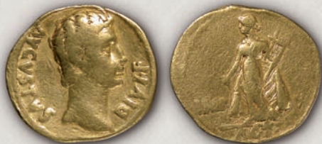
Октавијан Август ауреус, Лугдунум, 11-10 г. пр.н.е.

Иако златниот ауреус првпат бил пуштен во оптек во 84 г. пр.н.е., неговото поинтензивно емитирање се случило во времето на Октавијан Август. Покрај ауреусот, околу 20 г. пр.н.е. во циркулација биле: сребрениот денар, бронзените сестертиј, дупондиј, ас и семис. Покрај овие пари, по разни поводи биле ковани и медалјони, коишто не биле наменети за редовна циркулација (509).