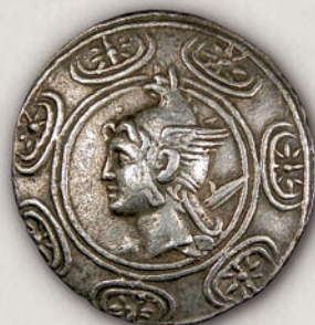
Филип V, тетрадрахма (аверс) Пела или Амфипол, 211-197 г. пр.н.е.

Овој македонски крал ковал статери, тетрадрахми, ди-драхми, драхми (159-161), хемидрахми и бронзени монети (162-184). На аверсната страна на пораните тетрадрахми е претставен неговиот портрет, а подоцна тоа место го зазема македонскиот штит во чиј центар е митскиот јунак Персеј.