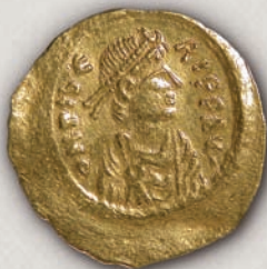
Маврикиј, тремиз (аверс) Константинопол, 583/4-602

Периодот на владеењето на императорот Маврикиј (582-602) (847-850) бил одбележан со постојани војни кои ја исцрпиле државната каса, поради што тој бил принуден да ги зголеми даноците. Станува збор за војната со Персија од една страна, како и за упадите на Аварите и Словените кои сè почесто го минувале дунавскиот лимес и ја пустошеле Византиската Империја за што, меѓу другото, сведочат и големиот број остави со пари што се откриваат денес. Најголемата остава со исклучиво бакарни рановизантиски пари којашто е досега регистрирана во светот е дел од Нумизматичката збирка на Народната банка на Република Македонија. Таа содржи 1 023 монети и била засолнета околу 583/84 година во екот на овие упади. Историчарот Евагриј, современик на Маврикиј, вели: „...Аварите стигнаа двапати до Големиот Сид, Сингидунум, Анхијал, цела Хелада и други градови и тврдини освоија и ограбија, уништувајќи и спалувајќи сè бидејќи огромната војска престојуваше на исток...“