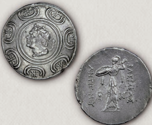
Антигон II Гоната тетрадрахма, Амфипол, по 271 г. пр.н.е.

По победата над Келтите, во 277 г. пр.н.е., синот на Деметриј I Полиоркет, Антигон II Гоната (277/6-239 г. пр.н.е.) се прогласил за крал на Македонија. Според легендата, во текот на оваа одлучувачка битка, на бојното поле се појавил богот Пан кој внел метеж во редовите на Келтите, по што војската на Антигон освојувала победа. Легендата нашла свој одраз во монетната иконографија, така што покрај изборот на вообичаените претстави карактеристични за монетите на наследниците на Александар III, по 271 г. пр.н.е. бил воведен нов иконографски тип на тетрадрахма. На аверсот е претставен македонски штит со претстава на Пан во средината, чиј лик веројатно е со индивидуални портретни карактеристики на Антигон, а на реверсот е Атена Алкидем („заштитничка на народот“), којашто била почитувана во Македонија.