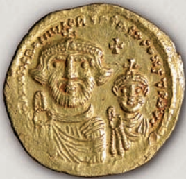
Ираклиј, солид (аверс) Константинопол, 616-625

Солидите и фолесите на Ираклиј (610-641) од првите години на владеењето се одликуваат со напуштањето на воените атрибути и воведувањето цивилна наметка (хламус) (859), која подоцна на бакарните пари повторно била заменета со оклоп и шлем. На реверсот на златните пари повторно бил вратен крстот, востановен од Тибериј II Константин.