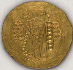
Алексиј I Комнен хиперпирон (реверс) Тесалоника, 1092/93-1118

Во втората половина на XI век, циркулацијата на пари на територијата на Р Македонија била зголемена, а една од причините била фискалната реформа во 1042 г., која била преземена од страна на братот на царот Михаил IV Пафлагонецот (1034-1042), а со која данокот во натура бил заменет со данок во пари. Покрај тоа, зголемената монетаризација може да се објасни и со распаѓањето на Самуиловата држава и потпаѓањето на македонската територија под византиска контрола, како и со инфлациските процеси, кои во овој период зеле замав.