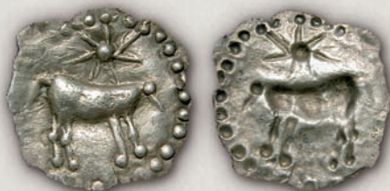
Дерони, хемибол по 480 г. пр. н.е.