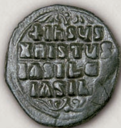
Анонимен фолис (реверс) Константинопол, 976(?) - 1030/35

Во времето на Константин X (1059-1067), византиската нумизматичка иконографија повторно го вклучила претставувањето на царот, сам или заедно со претставата на Исус Христос ( 885 ) или на Богородица. Овие пари паралелно циркулирале со анонимните фолеси сè до 1091 г.