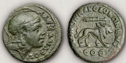
Псевдоавтономна монета на македонскиот којнон бронза од времето на Гордијан III, 238-244 г.

Во времето на Август (31 г. пр.н.е. - 14 г. н.е.), во римските провинции биле обновени или организирани провинциски органи што требало да се грижат за царскиот култ. Четирите мериди биле организирани во македонски којнон (заедница) на чие чело стоел свештеник, најчесто римски граѓанин, кој бил одговорен за јавните игри во чест на императорскиот култ. Овие игри биле одржувани во текот на годишното собрание во Берија, административниот центар на македонскиот којнон, но и во Тесалоника. Заедницата имала право да издава свои монети и веројатно во Тесалоника биле ковани бронзени монети без портрет на император со легенда \text{ΜΑΚΕΔΟΝΩΝ} (352-354), монети со портрет на император и неговата титула на предната страна, со легенда \text{ΣΕΒΑΣΤΟΣ ΜΑΚΕΔΟΝΩΝ} , \text{ΜΑΚΕΔΟΝΩΝ} на задната страна (355-357), а од времето на Веспасијан (69-79 г.) била воведена легендата \text{ΚΟΙΝΟΝ ΜΑΚΕΔΟΝΩΝ} (358-367).