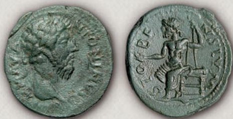
Марк Аврелиј, номинал II Стоби, 161-180

Локалитетот Стоби се наоѓа во близина на Градско, кај Велес, на местото каде што Црна Река се влева во Вардар. Археолошките истражувања покажуваат дека животот на античката населба се одвивал непрекинато од периодот од VII до VI век пр.н.е., па сè до крајот на VI век н.е. Во римскиот период, Стоби бил најголем град во провинцијата Македонија Салутарис (подоцна Македонија Секунда) и во него постоела римска заедница за чие значење зборува и добивањето муниципијален статус во 69 г., со што жителите на Стоби добиле ius Italicum и станале граѓани на Рим.