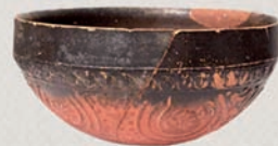
Калапена чаша Вардарски рид, Гевгелија, крај на II/I век пр.н.е.