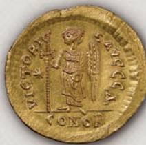
Јустин I, солид (реверс), 518-522 г.