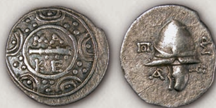
Автономно издание тетробол, 187/6-174/73 г. пр.н.е.

Најкарактеристичен мотив кој бил употребуван од страна на повеќето владетели на династијата Антигонида, е македонскиот штит кој бил национална гордост и симбол на етничкиот идентитет. Покрај неговата претстава на монетите, многу често со овој мотив биле украсувани предметите за секојдневна употреба, калапени чаши, чинии, тегови (III-II век пр.н.е.), што ја потврдува неговата голема популарност.