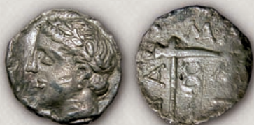
Дамастиж, тетربول с. 350/45-330 г. пр.н.е.

Во врска со парите на пајонските владетели е градот Дамастиж (4-8), чиешто лоцирање сè уште е предмет на дискусији. Неговите тетрадрахми, драхми и тетраболи биле ковани од околу 395 г. пр.н.е., па до 325/320 г. пр.н.е., а циркулирале на просторот од Македонија, јужна Србија, Косово, Бугарија, сè до Романија. Овие пари биле ковани под влијание на парите на Халкидичка лига и нејзината ковница во Олинт, а самите влијаеле на пајонското кралско ковање од средината на IV век пр.н.е.