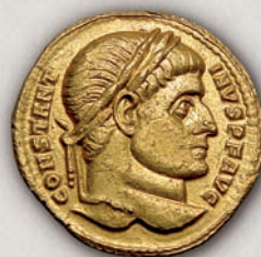
Константин I солид (аверс), Арл, 313 г.