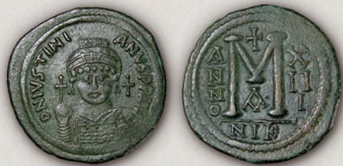
Јустинијан I, 40 нумии Никомедија, 539-540

Јустинијан I бил христијанин, убеден во божественото потекло на својата власт, што особено може да се забележи на неговите реформирани солиди на чиј аверс императорот, наместо дотогашното копје, држи глобус круцигер. Претставувањето на глобусот со крст го условило и свртувањето од тричетвртинска во анфасна биста на солидите (801-806), односно од профилна во анфасна на поголемите бакарни номинали (814-822). Со реформата од 538 година се случила уште една значајна промена, а тоа било воведувањето на индикциска година на реверсната страна на бакарните пари, а како реализација на законот којшто бил донесен претходната година.