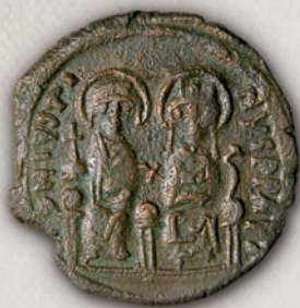
Јустин II, 40 нумии (аверс) Константинопол, 569-570

Во текот на своето владеење, Јустин II (565-578) се обидел да ја санира економската состојба во Византија со плаќање на државните долгови, намалување на даноците и воспоставување контрола врз емисиите на пари. Со цел да биде мален притисокот врз државната каса, Јустин II ја редуцирал тежината на фолисот на 13,5 г, а биле прековувани и монети на неговиот претходник. Ова е особено карактеристично за изданијата на Тесалоника во првите години на неговото владеење, кога монетите со вредност од 16 нумии биле прековувани врз 20-нумиски номинали.