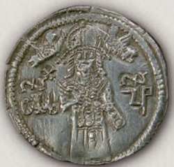
Стефан Душан (1346-1355) динар (аверс)

Во втората половина на XIII век, паралелно со венецијанските грошеви во Македонија циркулирале динарите на српските владетели (945-958). Српската средновековна држава почнала да емитира свои пари во времето на кралот Радослав (1227-1234), но дури по освојувањето на северниот дел на Македонија од страна на кралот Милутин во 1282 г. тие станале доминантна парична единица на овие простори. Српските динари во почетокот ги имитирале венецијанските грошеви, а од првата половина на XIV век динарите добиле чисто византиска иконографија. Покрај овие промени, и инскрипциите од латински се смениле во кирилски.