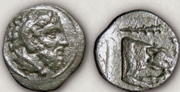
Архелај, обол 413-399 г. пр.н.е.

Во однос на неговата монетарна политика, Архелај останал забележан заради реформата со која бил променет дотогашниот тежински стандард, односно за основа на паричниот систем бил прифатен т.н. лидиско-персиски стандард, но со локални карактеристики. Покрај тоа, повторно биле воведени големи номинали во сребро коишто требало да ги задоволат потребите на надворешната трговија. За потребите на локалниот пазар биле ковани поситни сребрени номинали, како и бронзени пари, коишто првпат биле воведени во употреба во 400 г. пр.н.е.