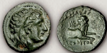
Леон, бронза 278-с.250 г. пр.н.е

патрај бил наследен од неговиот син Авдолеон (315 - 286/5 г. пр.н.е.) (16-18), кој ковал повеќе видови тетрадрахми, ди-драхми, драхми и тетраболи на чии аверси најчесто е претставена Атина. Во почетокот на своето владеење тој имал добри односи со Македонија, којашто во 310 г. пр.н.е. му помогнала во борбата против Автаријатите. Во периодот од 315 до 306 г. пр.н.е., монетите биле ковани според пајонскиот тежински стандард, претставите на неговите порани драхми биле блиски со оние на Патрај (портрет на кралот на аверсот и протом на дива свиња на реверсот), а еден тип на тетраболи на аверсот имаат претстава на Дионис, наместо вообичаената претстава на Атина. Во 306 г. пр.н.е. Авдолеон, следејќи го примерот на дијадосите ја зел титулата базилеј и почнал да издава тетрадрахми според атичкиот тежински стандард, коишто типолошки биле исти со оние на Александар III Македонски, што исто така било карактеристично за наследниците на Александар. Добрите односи со Македонија биле прекинати во времето на македонската династија на Антигонидите. Во 289-88 г. пр.н.е., кога Антигон Гонат го зазел главното пристаниште на Атина, Авдолеон го снабдувал градот со жито и за таа помош собранието донело одлука нему и на неговите наследници да им биде доделено атинско граѓанско право, а на агората да биде подигната негова бронзена коњаничка статуа.