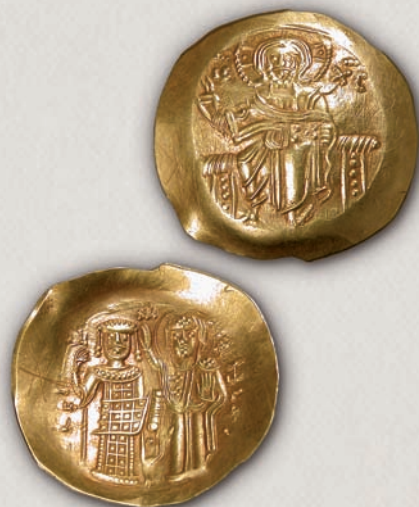
Јован III Дука Ватац хиперпирон (реверс) Магнезија, 1232-1254

Во времето на Јован III Дука Ватац (1222-1254) (924,925) територијата на Никејското Царство била двојно зголемена. Со цел да ја зајакне економијата, овој цар настојувал да го развива домашното стопанство и го забранил купувањето луксузни производи од странско потекло. Сите требало да се задоволат „со тоа што го раѓа римската земја и римските раце го произведуваат“, а царот се обидел тоа да го потврди со свој пример, па круната на царицата била изработена со парите кои биле заработени од продажбата на јајца од царскиот имот.