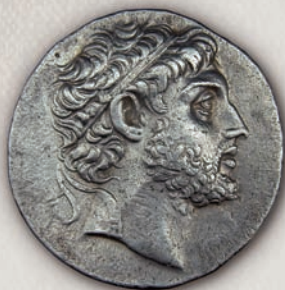
Филип V, тетрадрахма (аверс) Пела или Амфипол, с.220-211 г. пр.н.е.

Филип V (221-179 г. пр.н.е.) дошол на македонскиот престол по смртта на неговиот татко Демитриј II (230/29 г. пр.н.е.), кога имал само девет години, па управувањето со државата го презел Антигон Досон (229-221 г. пр.н.е.). Во 221 г. пр.н.е., Антигон погинал во битката со Илирите, по што Филип V завладеал со Македонија.