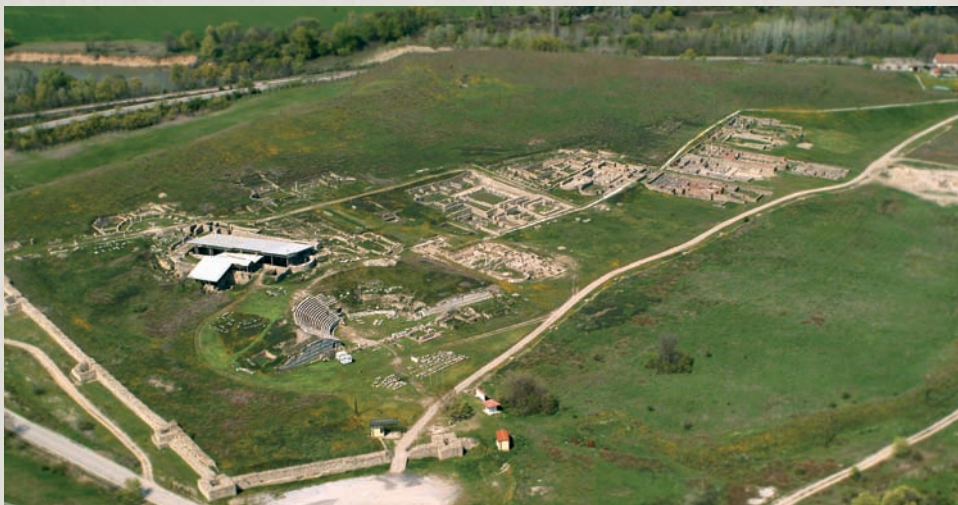
Авионска фотографија на локалитетот Стоби

Меѓу мноштвото градови кои во римскиот империјален период добиле дозвола да издаваат пари, на територијата на Р Македонија денес се наоѓа единствено Стоби. Од таа причина, подзбирката на стобиски монети во нумизматичката збирка на НБРМ постојано се збогатува и денес, со 2 500 монети, таа претставува најголема јавна збирка на стобиски монети во светот.