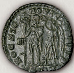
Константиј II, нумус (реверс) Сирмиј, 351-355

Покрај симболите поврзани со христијанството, на монетите на Константиј II, Ветраниј и на Константиј Гал се јавува инскрипцијата NOB SIGNO VICTOR ERIST (со овој знак победувај) (709). Според легендата што ја пренесува историчарот Евзебиј во делото „Животот на Константин“ ( Vita Constantini ), Константин I пред битката кај Милвискиот мост имал визија во која сонцето се претворило во крст, а потоа се појавиле овие зборови. Во битката, војниците на Константин I и Ликиниј I носеле штитови на кои се наоѓал Христовиот монограм. Константин извојувал победа и во 313 г. бил потпишан познатиот едикт.