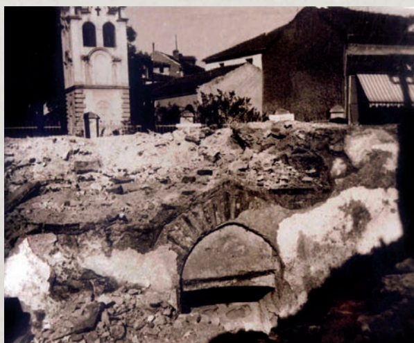
Остатоци од скопската ковница по земјотресот во 1963 г. (од фототеката на Музејот на град Скопје)

Ковањето на отомански пари во Македонија траело околу 170 години, сè до средината на XVII век, кога султанот Ибрахим (1640-1649) ги затворил сите провинциски ковници на Балканот. Причината за нивното затворање било постојаното намалување на квалитетот на монетите, како и нивното фалсификување.