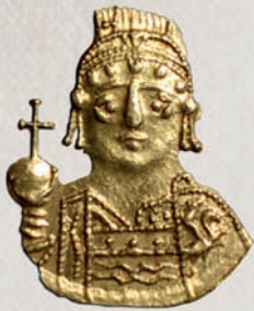
Биста на Јустинијан I солид (аверс), Константинопол, 542-552

Петрус Сабатиј или Јустинијан I (527-565) бил роден околу 483 г. во Таврисиј (Таор), Скопско. Како внук на Јустин I во 525 г. ја добил титулата кајсар, а на 4 април 527 г. бил прогласен за август и негов со-владетел. Нивното заедничко владеење траело само 4 месеци, што е причина за реткоста на монетите ковани во името на ова совладетелство (798). Во историјата останал запаметен по неговите напори да ја возобнови Римската Империја, по кодификацијата на римското право, како и по огромниот број градби коишто биле подигнати низ целата Империја.