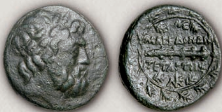
Четврта македонска мерида, бронза, Пелагонија, 167-149 г. пр.н.е.

Амфипол, центарот на првата мерида, во истиот период започнал да издава тетрадрахми со претстава на Севс на аверсот и Артемида Тавропол со легенда ΜΑΚΕΔΟΝΩΝ ΠΡΟΤΗΣ на реверсот. По повторното отворање на рудниците во 158 г. пр.н.е., монетното производство на Амфипол значително било зголемено (217-222), а сребрени тетрадрахми ковала и Тесалоника, центарот на втората мерида. На овие тетрадрахми е претставена Артемида во македонски штит на аверсот, а на реверсот е суровицата на Херакле со легендата ΜΑΚΕΔΟΝΩΝ ΠΡΟΤΗΣ во дабов венец. Досега не се регистрирани монети на центарот на третата мерида, Пела.