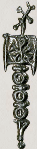
Христорам на лабарум Констанс II, нумус (детал) Сискија, 337-340

По потпишувањето на Миланскиот едикт во 313 г. од страна на Константин I (655) и на Ликиниј I (641), христијанството било официјализирано како религија рамноправна на другите религии во Царството. Христијанските симболи постепено навлегувале во монетната иконографија. Во почетокот тоа биле мали симболи, најчесто христорам (христовиот монограм), кој некогаш се наоѓа на воениот знак (705, 706, 709, 711, 713 и 714), а понекогаш го пополнува целото реверсно поле. Денешниот најпрепознатлив христијански симбол, крстот, во монетната иконографија се појавил дури во V век. На монетите на Магнентиј и на Константиј II, христорамот понекогаш е комбиниран со буквите алфа и омега - Христос е алфа и омега, почеток и крај (Јовановото откровение). Дискретно присуство на христијанска иконографија на парите е забележливо и во претставата на Константин I со подигната глава (670) којашто, веројатно, треба да сугерира став на човек што се моли.