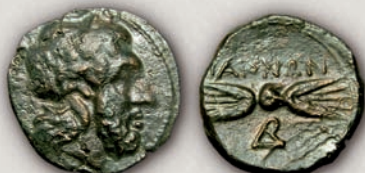
Дропион, бронза с. 250-230 г. пр.н.е.

По келтската инвазија во 279 г. пр.н.е., територијата на Пајонија била опустошена и економската состојба не овозможувала ковање сребрени пари, така што кралот Леон (278 - с.250 г. пр.н.е) издавал само бронзени пари во неколку различни номинали.