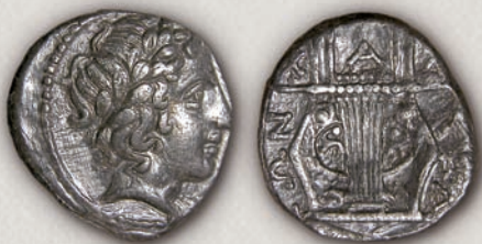
Халкидичка лига, Олинт тетробол, 432/31-430 г. пр.н.е.

Покрај поголемите номинали, во периодот помеѓу 476/75 и 460 г. пр.н.е., Александар емитувал октообол и тетробол, обележени со буквите А и Н (91-92). Овој македонски паричен систем бил заснован врз феникискиот тежински стандард, односно бил негова редуцирана варијанта.