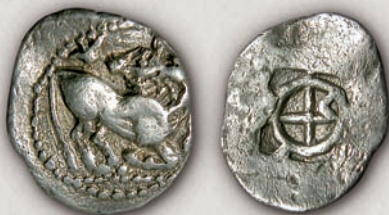
Ихне, трихемибол 500-480 г. пр.н.е.

Поголемите номинали најчесто содржат композиции на човек и говедо. Кај деронските и лајајските примероци (3) е прикажано некое локално божество или можеби самиот владетел во кола влечена од говедо. Сонцето, шлемот или растителниот мотив, коишто често се дел од аверсната композиција, можно е да претставуваат своевидни ковнички знаци.