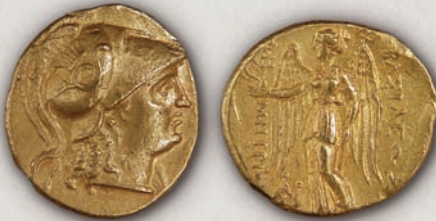
Деметриј I Полиоркет статер, Пела, с. 291-290

Со доаѓањето на власт на Деметриј I Полиоркет (294-287 г. пр.н.е.), во Македонија се зацврстила династијата на Антигонидите. Овој македонски крал го добил својот епитет Полиоркет (Опсадник) по употребата на опсадни машини во нападот на Родос во 305 г. пр.н.е. Парите што биле издавани во почетокот на неговото владеење биле идентични со оние на Александар III Македонски, што било вообичаено и за другите наследници, но околу 292 г. пр.н.е., Деметриј вовел свој тип монети на чиј аверс е претставен неговиот портрет.