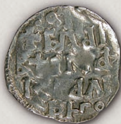
Марко, 1371-1395 динар (реверс)