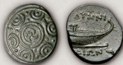
Лихнид, бронза, 187-171 г. пр.н.е.

Бронзените монети на Лихнид се исклучително ретки и од триесетина досега познати примероци може да се претпостави дека тие првенствено биле во функција на локалната економија.