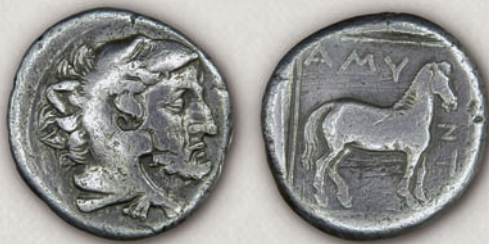
Аминта III, дидрахма 389-383 г. пр.н.е.

Убиството на кралот Архелај во 399 г. пр.н.е., го означило почетокот на еден четириесетгодишен период на политичка нестабилност, предизвикана од честите промени на македонскиот престол. Меѓу ретките сведоштва за овој период се монетите на Аероп II (398/7-395/4 г. пр.н.е.) (99а), Аминта II (395/4 г. пр.н.е.), Павсаниј (395/4-393 г. пр.н.е.) (100), Аминта III (393-370/69 г. пр.н.е.) (101-102) и Пердика III (365-359 г. пр.н.е.) (103), коишто се чуваат во Нумизматичката збирка на НБРМ.