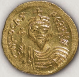
Фока, солид (аверс) Константинопол, 607-609

Овие состојби траеле прилично долго и на крајот, во 602 г., завршиле со бунт предводен од младиот офицер Фока. Фока (602-610) го обележал своето владеење со обид да ја консолидира државата и меѓу првите чекори кои ги презел било намалувањето на даноците. Оваа постапка била дочекана со одобрување во Константинопол, но набргу станало јасно дека фискалната политика на Маврикиј била неопходна поради војните што ги водело Царството.