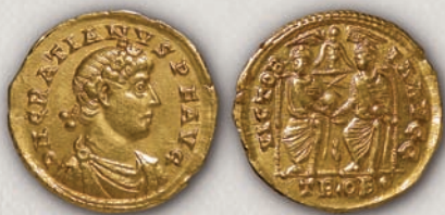
Гратијан, солид, Тревери, 367-375

Се претпоставува дека бронзените нумуси воведени од Константин I во 317-18 г. се викале кентенионали. Со реформата на Константиј II и Констанс во 348 г., тие биле демонетизирани, а биле воведени нумуси со поголема тежина (AE 3), коишто можеби го носеле називот мајорина.