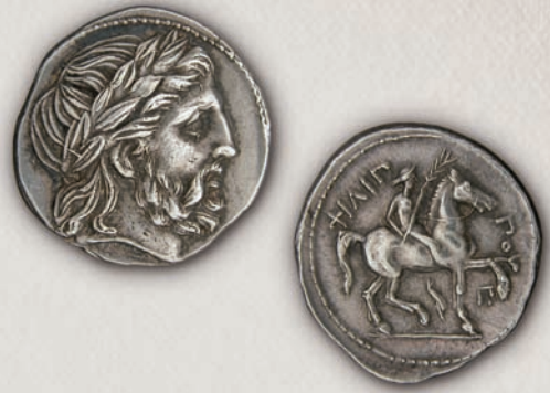
Филип II Македонски, тетрадрахма Амфипол, с.323/2- с.316/5 г. пр.н.е.

Меѓу неговите први успеси во 357 г. пр.н.е. било освојувањето на градот Амфипол, којшто претставувал значајна стратешка точка. Оттука бил контролиран патот кон Тракија и, што е уште позначајно, градот се наоѓал во близина на Пангејската Планина, богата со златна и со сребрена руда.