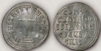
Константин VI (780-797) Милиаресиј, Константинопол

Освен еден милиаресиј на Константин VI (780-797), кој е дел од Нумизматичката збирка на НБРМ, во Р Македонија, досега не е регистрирана друга монета од периодот на првото владеење на Јустинијан II (685-695), па сè до Теофил (829-842).