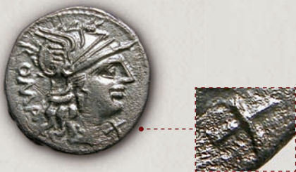
Минукиј Авгурин денар (аверс), Рим, 135 г. пр.н.е.

Со паѓањето на Македонија под власт на Римјаните, покрај провинциските монети, во првата половина на I век пр.н.е., во циркулација на територијата на Република Македонија влегол и римскиот денар.