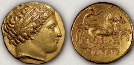
Филип II Македонски, статер Пела, с.340-с.328 г. пр.н.е.

Набргу по неговото доаѓање на власт, започнало ковањето на Филиповите сребрени пари во Пела, а околу 357/56 г. пр.н.е. и во Амфипол (105). Со монетарната реформа којашто била спроведена во 345 г. пр.н.е., Филип II, првпат во монетарната историја на Македонија, вовел златна номинала. Златниот статер (104) бил кован во истите ковници во кои биле произведувани сребрените пари, а заради флексибилност на монетарниот систем биле издавани и неговите фракции: 1/2, 1/4 (104a), 1/8 и 1/12 од статерот. За статерите бил користен атичкиот тежински стандард, додека за тетрадрахмите локалниот македонски тежински стандард.