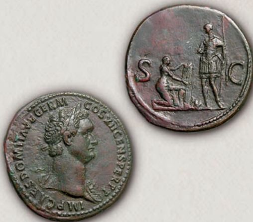
Домитијан сестертиј, Рим, 86 г.

Во текот на II, а особено во III век постепено била намалувана чистотата на среброто во денарите, што довело до нивно обезвреднување. Со монетарната реформа спроведена од страна на императорот Каракала (211-217) во 215 г. бил воведен антониџан, нова сребрена монета именувана според неговото име - Марк Аврелиј Антониниј. Покрај антониџанот, во оптек биле и златниот ауреус, билоновиот денар и бронзениот сестертиј, кој последен пат бил искован во седумдесеттите години на III век.