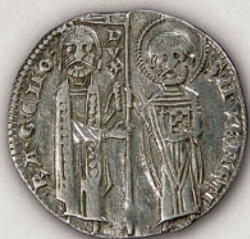
Раниери Зено (1253-1268) грош (реверс), Венеција

Венецијанскиот грош (941-944), кој бил воведен во времето на дуждот Енрико Дандоло (1192-1205), со својата стабилна тежина од 2,17 г и непроменливата чистота на среброто од 98,5%, станал доминантно платежно средство во трговијата низ Медитеранот.