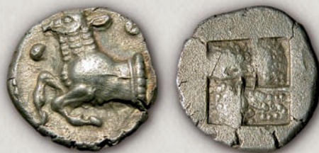
Дерони, трибол 500-480 г. пр.н.е.

На територијата на Р Македонија досега се регистрирани монети на племињата Дерони (1, 2), Лаијаи (3), Орески, градовите Ихне (коишто веројатно можат да му се препишат на племето Ихнаи) и Лете, како и монети кои веројатно биле ковани во регионот на Крестонија или Мигдонија.