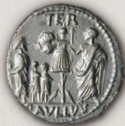
Л. Ајмилиј Лепид Паул денар (реверс), Рим

Победа на Ајмилиј Паул над Македонија била прославена во Рим, каде што три дена триумфалните поворки го прикажувале воениот плен кој, меѓу другото, се состоел од огромен број уметнички дела, садови од благородни метали и пари. Според Плутарх, сребрените пари биле носени во седумстотини и педест садови, од кои секој содржел по три таланти (1 талант = околу 26 кг), а златните - во седумдесет и седум сади по три таланти. Богатиот воен плен толку ја збогатил државната каса, што народот не плаќал посебни даноци сè до 43 г. пр.н.е.