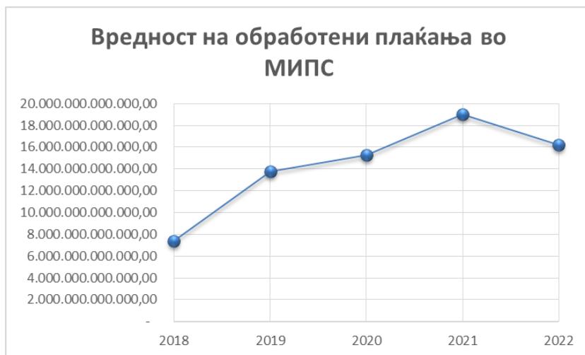
Графикон 2: Вредност на плаќања обработени во МИПС по години